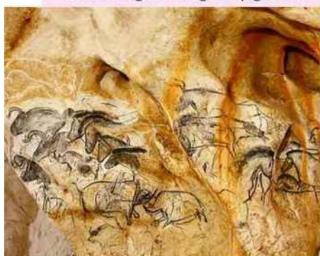
Le panneau de chevaux, l'un des plus beaux ensembles de la grotte.

Grand Site de France, l'Aven d'Orgnac est la troisième grotte la plus visitée de France : 100 millions d'années, 20 hectares, un dénivelé de 121 mètres avec des voûtes à 55 m de hauteur où les draperies de cristal évoquent un conte de fées. 07150 Orgnac-L'Aven. Tél. : 04 75 38 65 10. www.orgnac.com . Découverte en 1836, la grotte Saint-Marcel abrite la Fontaine de la Vierge, cent bassins cristallins de différentes couleurs selon leur profondeur, magnifiés par le spectacle son et lumière. 2759, route touristique des Gorges de l'Ardèche. Tél. : 04 75 04 38 07. www.grotte-ardeche.com .