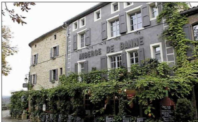
■ Deux maisons très différentes abritent les onze chambres de cet hôtel de charme.